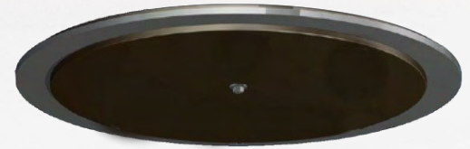
Ansicht von unten