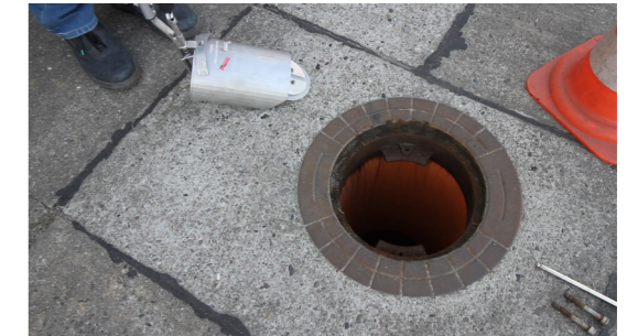
3. Geruchsverschluss-System mit dem Einbauwerkzeug greifen