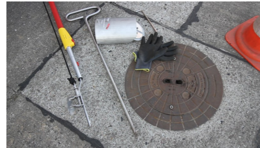
1. GVK und Einbauwerkzeug bereitlegen

Für den Anwender sind alle eventuell notwendigen baulichen und verkehrsrechtlichen Voraussetzungen sowie die Einhaltung der Gesundheits- und Unfallverhütungsvorschriften sicher zu stellen.