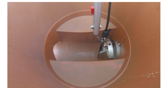
6. Geruchsverschluss-System bis zum Anschlag in das Rohr hineinschieben. Einbauwerkzeug lösen.