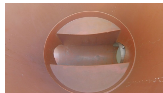
6. Geruchsverschluss-System ist eingesetzt.