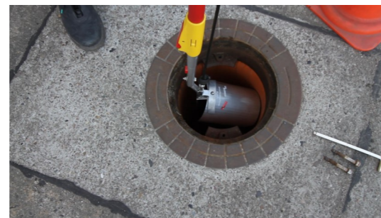
4. Das System mit einer Schwenkbewegung in den Schacht einbringen