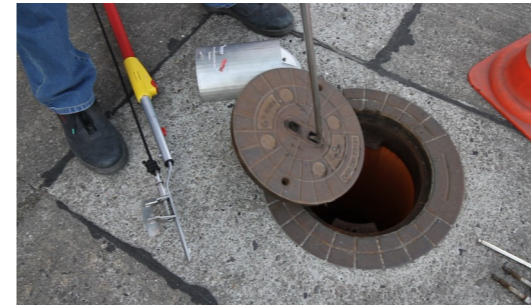
2. Schachtdeckel öffnen