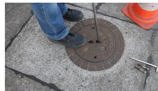
7. Schachtdeckel wieder schließen, fertig!