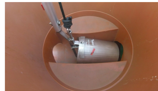
5. Geruchsverschluss-System in einer Flucht mit dem Gerinne ausrichten.